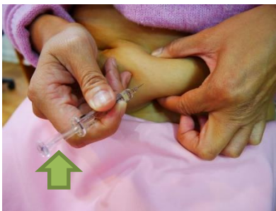
針刺進皮膚藥劑推完後拔出