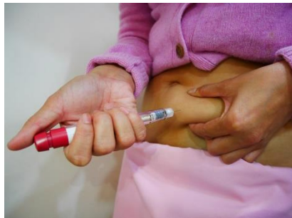
針刺進皮膚後按壓紅色的頭 藥劑推完後，針停留 10-15 秒後拔出