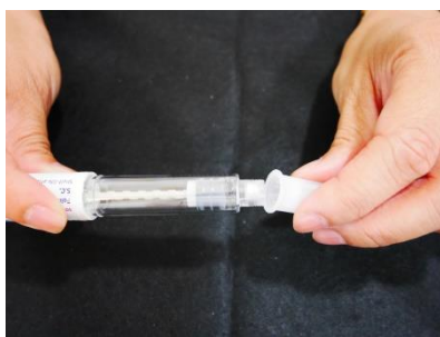
將針頭與筆針以旋轉方式組合