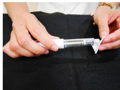
使用酒精棉片消毒筆針前端